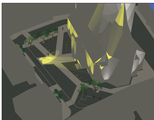
Obr. 2. Studie revitalizace Kostelního náměstí v Litoměřicích z ateliéru doc. Mužíka na ČVUT v Praze; kategorie Nová inspirace by především měla upozornit na problematiku navrhování městského mobiliáře, včetně prvků veřejného osvětlení

nání s ostatními evropskými metropolemi si česká města vedou velmi dobře. Velký kus práce je sice ještě čeká, ale proč neukázat dosažené úspěchy?